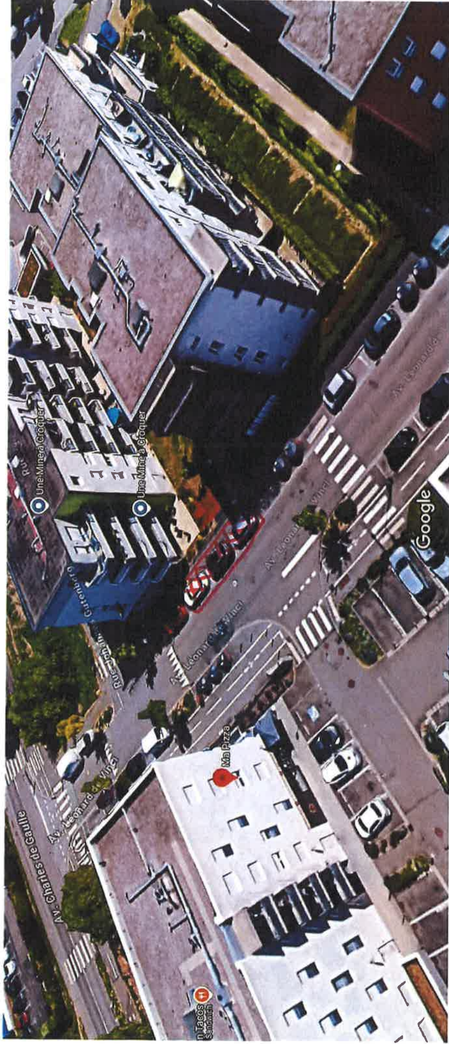
Images ©2025 Google, Données cartographiques ©2025, Données cartographiques ©2025 5 m